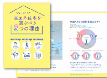
省エネ住宅のリーフレット