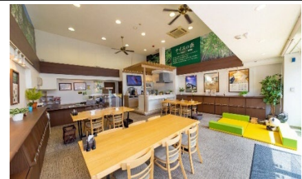
住まいる Cafe 鶴見西 内観

マンションや一戸建住宅、土地の購入や売却のほか、貸したい、リフォームしたいなど、お住まいに関するご相談にワンストップで対応する店舗です。