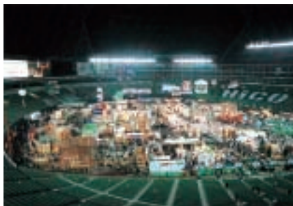
ナイスわくわくフェア福岡ドーム

「住まいの構造改革」をキーワードに、木造住宅の耐震技術の普及と、お客様の住宅に対する潜在需要の喚起を目的とする「ナイスわくわくフェア」を全国で展開、東京ビックサイトに加え、ポートメッセなごや、福岡ドームで新たに開催いたしました。改正建築基準法に関する最新情報の発信や、取引先様と一体となって住まいづくりの提案を行った結果、当上半期の来場者総数が10万名を越すなど、大変ご好評をいただきました。