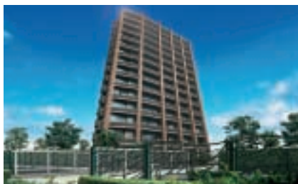
グランバース溝の口（川崎市）

マンションは、通期における売上計上予定物件のうち92%が、一戸建住宅も72%が契約済みとなるなど順調に推移しております。商品開発では、女性の視点で企画した人気のコンパクトマンション（グランバース溝の口）や、環境負荷に配慮した外断熱工法など、新たなコンセプトも積極的に取り入れ、ご好評をいただいております。