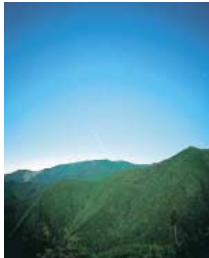
ナイス新宮の森 取得年：昭和55年 所在地：和歌山県新宮市高田 総面積：140.5ヘクタール