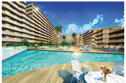
アイランドガーデン（中庭）完成イメージ

東京と横浜の中間に位置するベイエリア（横浜市鶴見区、約30,000㎡）に建設中のマンション「ヨコハマ アイランド ガーデン」（地上11階建、総戸数740戸。平成16年3月完成予定。相模鉄道㈱との共同事業）が登録を開始、第1期1次（241戸）には約1,500組のお客様が来場し、即日完売いたしました。水と緑のゆとりある空間と高い機能性が特徴で、敷地内には医療施設、保育施設、室内温水プール、コンビニエンスストアを設置するほか、屋上緑化を推進するなど共用部の充実ぶりと、リーズナブルな分譲価格が好評です。