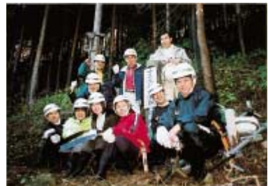
「県民手づくりの森」でのボランティア活動 (神奈川県東丹沢)