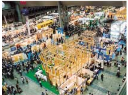
来場者でにぎわう「ナイスわくわくフェア」会場

「住まいの構造改革」キャンペーンの一環として、お客様の耐震性に対する関心と、新築住宅への潜在需要を喚起するイベントを積極的に開催いたしました。具体的には、東京ビッグサイトにおける住まいの総合展示会「ナイスわくわくフェア」をはじめとして、メーカーのショールームを有効活用する「住まいのガッテン（合展）」や、建築現場などで強い構造をアピールする「新築拝見」など、工務店様主催による展示会をコーディネートし、着実な需要創造を目指しております。