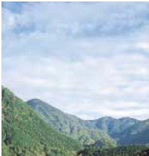
ナイス川根の森 取得年：平成13年 所在地：静岡県榛原郡川根町 総面積：102.7ヘクタール

これからも日向山ハイキングコースに面する「ナイス七沢の森」をはじめ、皆様に愛され、親しまれる森へと育ててまいります。