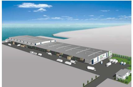
港湾地区で24時間操業も可能に

首都圏における住宅建築用資材の物流体制強化を目的に、千葉県木更津市にて総合物流センター（敷地面積約36,000㎡）の建設を行っております。東京湾アクアライン、館山自動車道、国道16号線が交差する交通の要衝という立地を生かし、強度および精度の優れた構造用集成材の物流エリアおよび取扱量を拡大するとともに、強度に優れた金物工法などにも対応するプレカット工場を併設し、平成15年1月にオープンを予定しております。