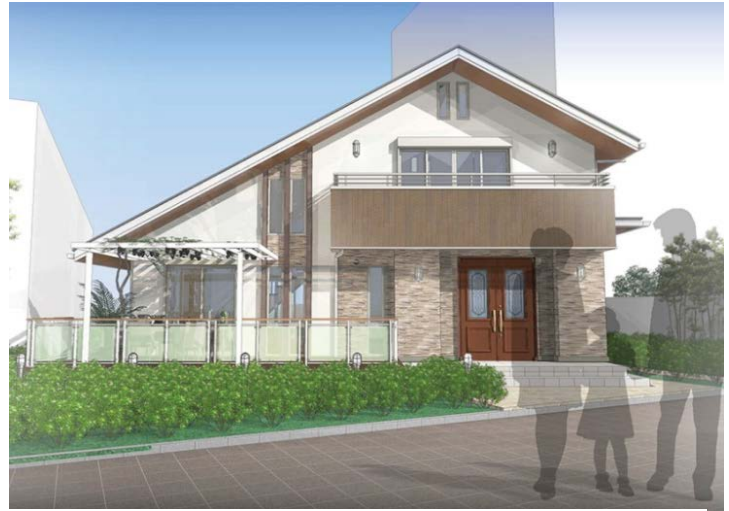
環境性能に加えて健康にも配慮した「スマートウェルネス体験パビリオン（仮称）」（イメージ）※2015年秋オープン予定