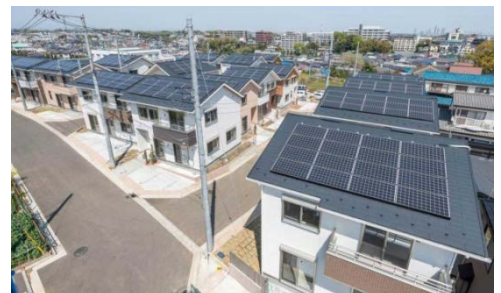
ゼロ・エネルギー・タウン (2014年横浜市)